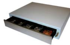
Caja de Dinero