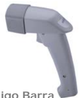
Lector Código Barra