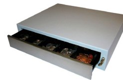
Caja de Dinero