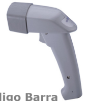
Lector Código Barra